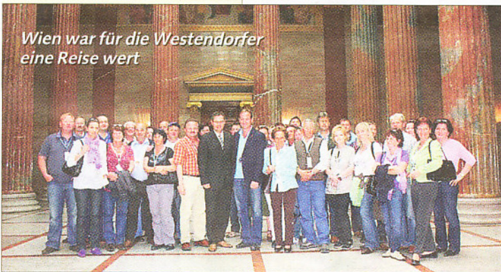
Wien war für die Westendorfer eine Reise wert

Besonders beeindruckt war die Gruppe vom Musical „Rudolf“. Selbstverständlich durfte bei dieser interessanten Wienfahrt der Besuch beim Heurigen nicht fehlen.